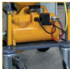
Compresseur à membrane de 250 l installé sur la version triphasée.