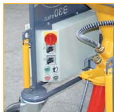
Le tableau de bord gère toutes les fonctionnes aisément.