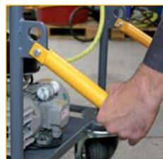
Déplacement aisé grâce à ses poignées.