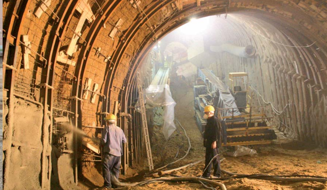
Béton projeté metro de Naples