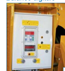
avec memory card intégré