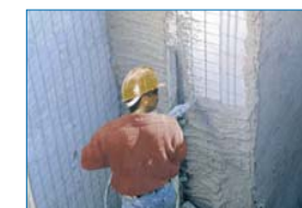
Projection de mortier sur panneaux de polystyrène avec treillis soudé