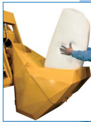
Charge de polystyrène perles