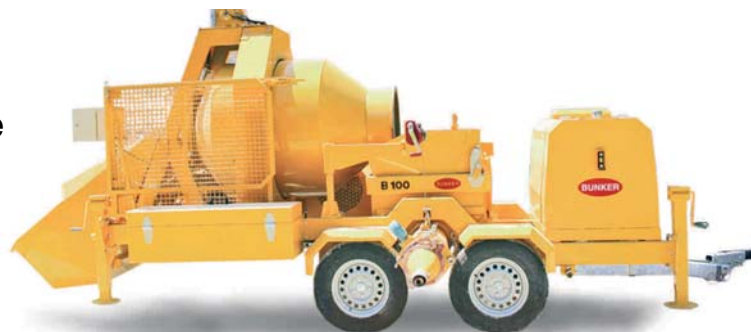
B100xp équipée avec double essieu freiné ALKO