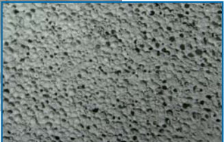
structure du ciment cellulaire

Le ciment cellulaire est sûrement le matériau isolant le plus économique actuellement en production. Il est utilisé surtout comme chape isolante et légère coulée sur la dalle de fondation et comme support du chape traditionnelle en réduisant l'épaisseur et le poids. De plus, le ciment cellulaire aide beaucoup à l'atténuation acoustique du piétinement qui est causé surtout par sa structure irrégulière et sa faible résistance mécanique. La D100XP permet la production et la pose du ciment cellulaire de façon automatique et avec un moindre coût de main d'œuvre, en rendant ce matériau isolant, thermique et acoustique plus pratique à mettre en place et en même temps économique..