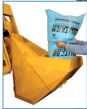
Charge de polystyrène perles avec additif