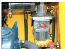
Nettoyeur à haute pression

La CLB18 est munie d'une télécommande avec câble électrique pour commander la pompe à distance. Une pratique radiocommande est disponible sur demande.