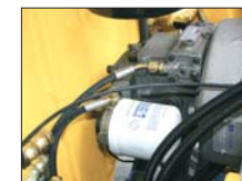
Pompe à débit variable