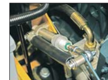
Quand on arrête le pompage, la mise au ralenti du moteur est automatique, ce qui réduit la consommation de carburant et les émissions sonores.