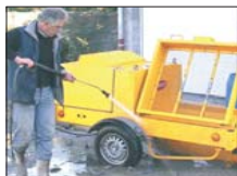
Lavage de la machine

Avec ses nombreux options comme sa radiocommande, son nettoyeur à haute pression, son compresseur de 400 l/min, son kit de nettoyage, la CLB18 est une machine vraiment unique et une des plus à l'avant-garde sur le marché.